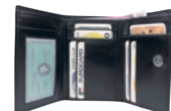
1360 1701 Damen-Kombibörse „B-Design“ Edle Damen-Kombibörse mit viel Platz für alles, was die Dame braucht