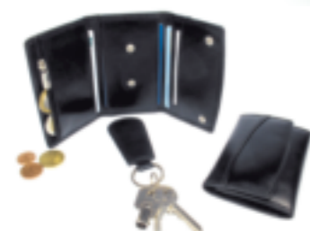
1190 1801 Schlüsselsetui 3-teilig „B-Design“ Elegantes Schlüsselsetui mit 2 vernieteten Schlüsselringen und 1 abnehmbaren Schlüsselanhänger