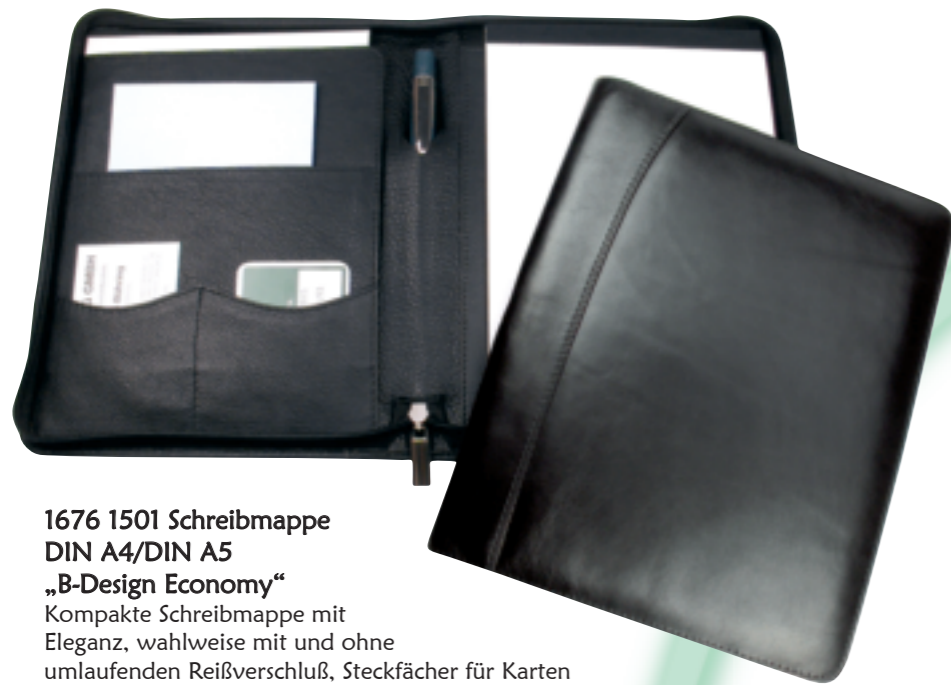
1676 1501 Schreibmappe DIN A4/DIN A5 „B-Design Economy“ Kompakte Schreibmappe mit Eleganz, wahlweise mit und ohne umlaufenden Reißverschluß, Steckfächer für Karten und Dokumente