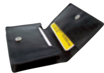
1505 1401 Visitenkartenetui „Vika-MB“ Unser Bestseller mit Magnetknopf auch mit verdecktem Magnet (1505 1201) mit SD-Kartenfächern (1505 1301) und klassisch (1505 0101)