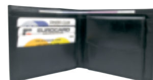
1360 1201 Scheintasche „B-Design Slim“ Superflache Scheintasche