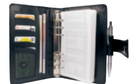
1691 1701 Organizer DIN A7 „B-Design“ Edler Organizer mit eleganter Lasche mit Magnetverschluß und diversen Steckfächern, wahlweise mit oder ohne Kalendereinlagen und Schreibgerät