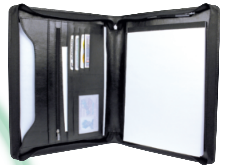
1671 1401 Schreibmappe DIN A4 „B-Design Grand“ Repräsentative, exklusive Schreibmappe mit umlaufendem Reißverschluß, diversen Steckfächern für Dokumente, Visitenkarten etc.