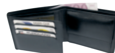
1190 1301 Scheintasche „B-Design Elegance“ Elegante Scheintasche mit mehreren zusätzlichen Steckfächern