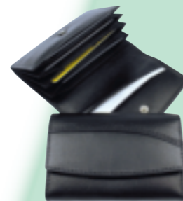
1190 1901 Kreditkartenetui „B-Design“ Repräsentatives, kompaktes Kreditkartenetui mit Platz für viele Karten