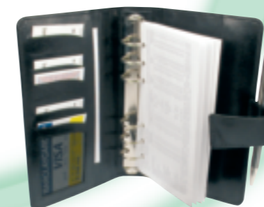
1691 1601 Organizer DIN A6 „B-Design“ Edler Organizer mit eleganter Lasche mit Magnetverschluß und diversen Steckfächern, wahlweise mit oder ohne Kalendereinlagen und Schreibgerät