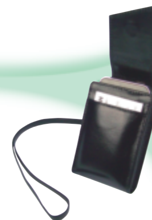
2908 1001 Smartphone-Etui „Stardust gloss“ innovatives Etui für Smartphone mit Lanyard