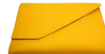
MMDesign, M. Makedonski