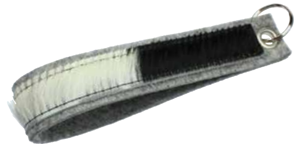
Sling-FL Cow Spot

Kleinere Farbabweichungen und gelegentliche Einschlüsse von Pflanzenteilen auf der Oberfläche stehen für die 100% natürliche Herkunft des Materials.