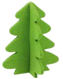
aus Wolle als natürlich nachwachsendem Rohstoff